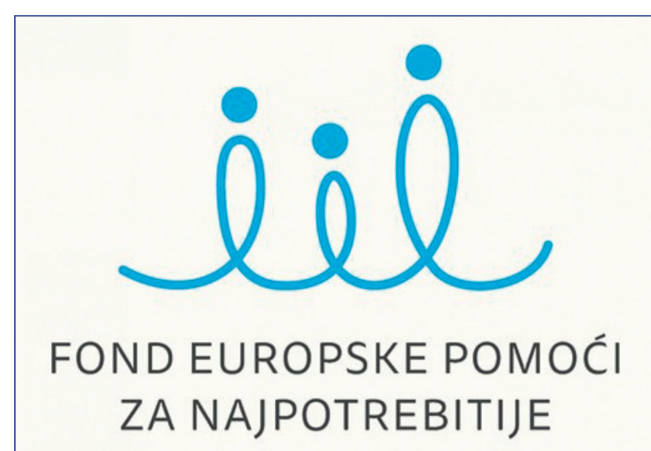
FOND EUROPSKE POMOĆI ZA NAJPOTREBITIJE