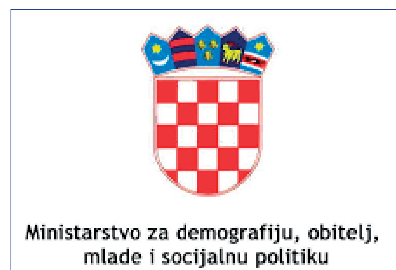
Ministarstvo za demografiju, obitelj, mlade i socijalnu politiku